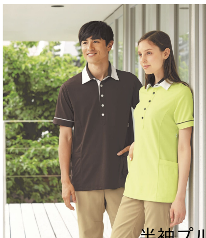
半袖プルオーバー(男女兼用) 介護ユニフォーム 24-8152-0403 M HEART GREEN HM2449-9(サクラ)