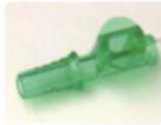
段付きアダプター (調節口付)